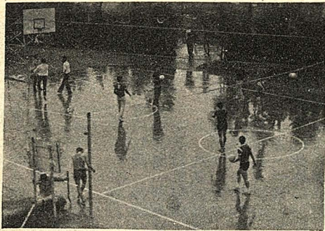
爭得新生杯類球王座，新鮮人 連雨中也得猛下功夫。圖與文：黃靜波

(本報訊)第四屆新生杯球賽，本月十六日十二時卅分，由各隊領隊在大義館一〇二室抽籤分組，十八日正式開賽。球賽採分組淘汰制，進入前四名球隊，舉行循環賽，決定冠、亞、季、殿軍。每天中午十二時至十三時，下午八時至十時，男生組至大倫館三三〇室，女生組至大莊館B三〇二室辦理。報名時間：本日截止，十五日截止。比賽項目男子組。